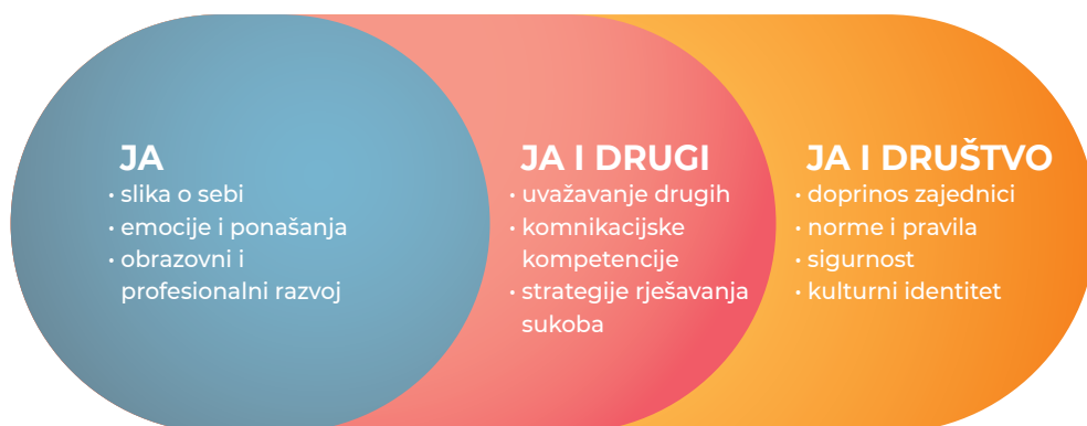
2. SLIKA: Grafički prikaz domena u međupredmetnoj temi Osobni i socijalni razvoj