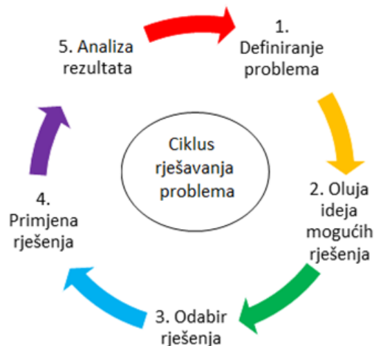
Slika 2. Ciklus rješavanja problema

Proces ili ciklus rješavanja problema pojednostavljeno je prikazan shemom (slika 2.). Sve počinje od prepoznavanja i definiranja problema koji ima neke manje ili više poznate činjenice i kontekst u kojem je nastao. Potom je potrebno osmisliti što više ideja o mogućim rješenjima problema jer se gotovo svaki problem mođe riješiti na više načina, što je potrebno osvijestiti učenicima. Nakon tog koraka slijedi donošenje odluke o odabiru najboljeg mogućeg rješenja i njegova primjena (testiranje), a na kraju analiza koja će pokazati koliko smo bili uspješni i je li se možda potrebno vratiti na neki prethodni korak i pokušati doći do boljeg rješenja. Prilikom analize važno je i osvijestiti što se napravilo dobro, a što treba unaprijediti kako bi bili učinkovitiji. Put do cilja nije jednostavan jer najčešće postoje brojne prepreke koje treba svladati, a za to je potrebno poznavati razne tehnike, alate i samu strategiju rješavanja problema, primjenjivati stečena znanja, vještine i kompetencije iz različitih nastavnih predmeta te biti ustrajan.