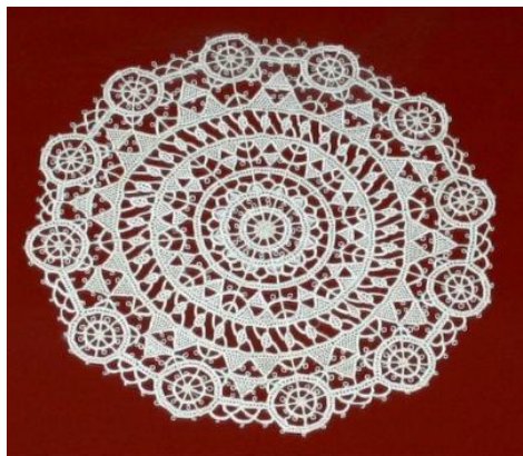
Slika 3. Paška čipka, dio hrvatske i svjetske kulturne baštine