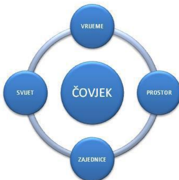
Slika 1. Makrokoncepti učenja i poučavanja društveno-humanističkog područja

Četiri navedena makrokoncepta svojim generalizacijama prerastaju društveno-humanističko područje. Povezujući sadržaje različitih predmeta i međupredmetnih tema, učenicima omogućuju učinkovit interdisciplinarni rad, a učiteljima suradničko planiranje i izvođenje procesa učenja i poučavanja.