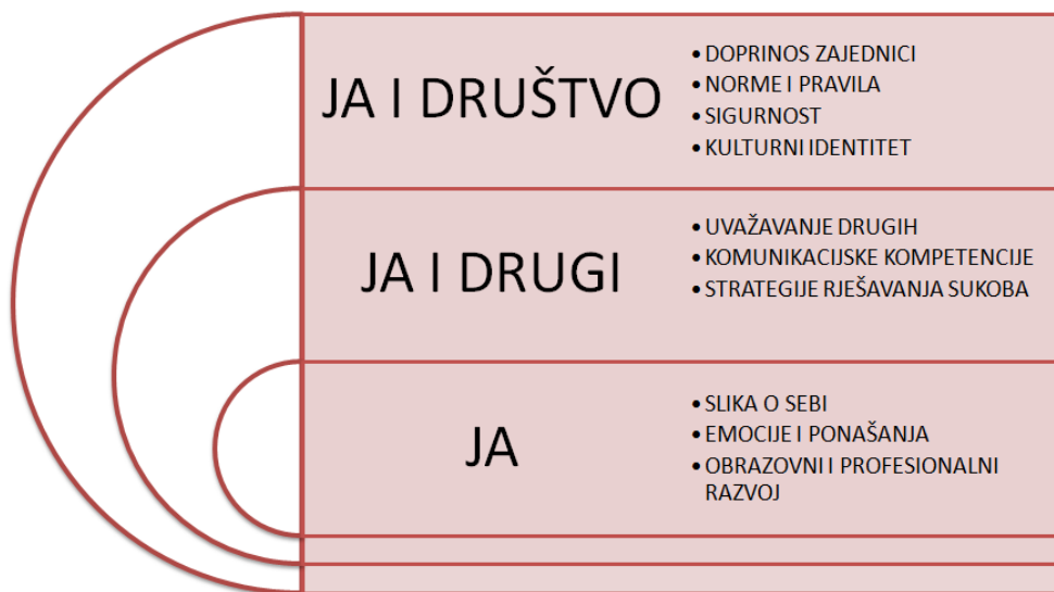
Slika 2. Grafički prikaz domena u međupredmetnoj temi Osobni i socijalni razvoj