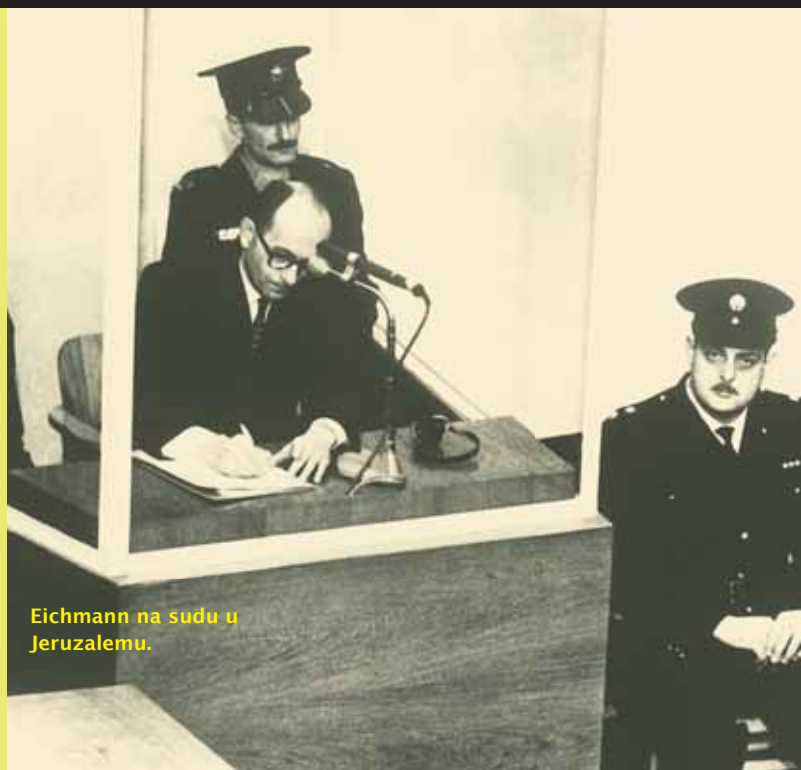
Eichmann na sudu u Jeruzalemu.