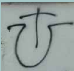
Antisemitski grafit i ustaški simbol, Split, 2006.

Neonacisti šire ideje osobito putem interneta, a dobivaju potporu drugih krajnje desničarskih skupina. Ljudi koji negiraju holokaust šire laži i očita im je namjera vrijeđati Židove. Zbog toga je negiranje holokausta uvreda koju treba kazniti u mnogim europskim državama.