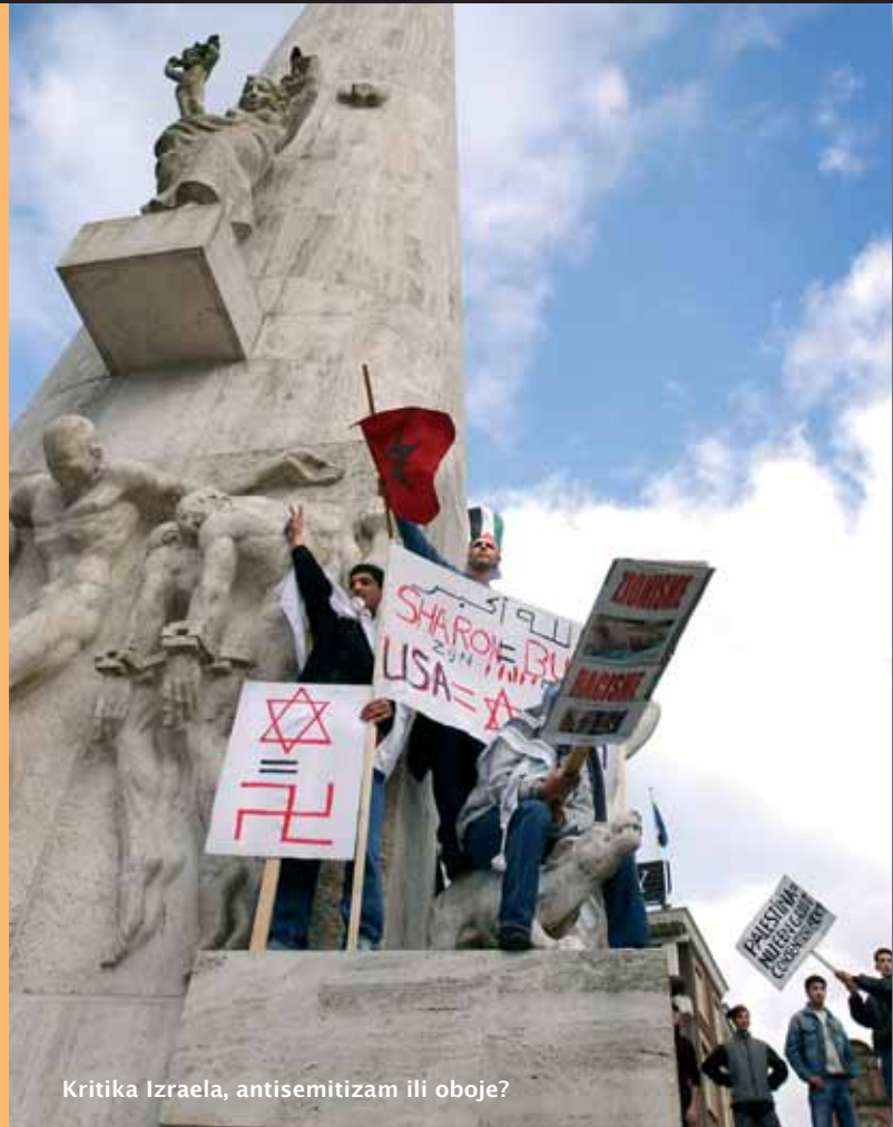
Kritika Izraela, antisemitizam ili oboje?

Židove se napada izvan Izraela. Godine 2003. napadnuto je nekoliko zgrada u Casablanci gdje su cilj bili Židovi. Ubijeno je pedeset i četvero ljudi. Odmah zatim Marokanci su izašli na ulice protestirajući protiv takvih napada.