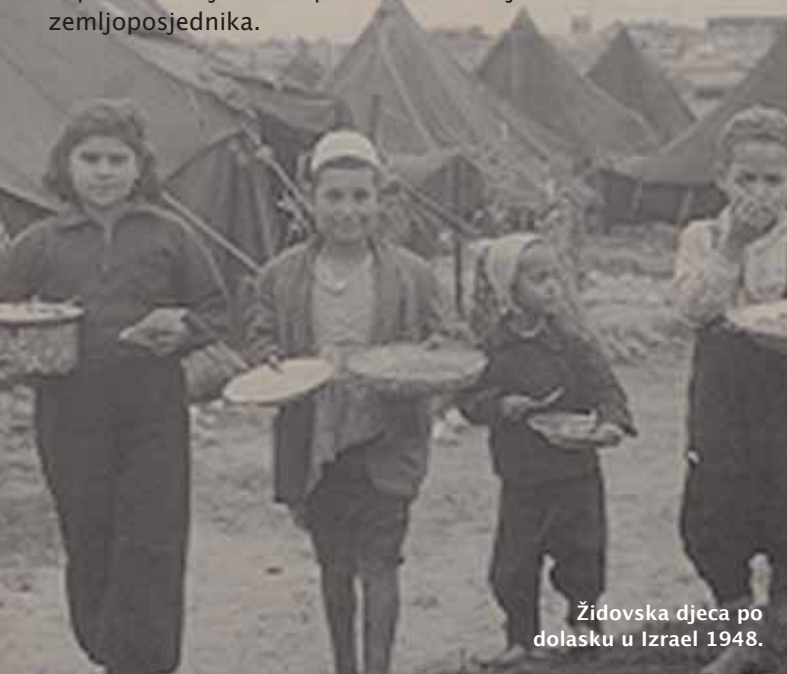
Židovska djeca po dolasku u Izrael 1948.

Cionizam je ime židovskoga pokreta koji se zalaže za neovisnost židovske države u Palestini.