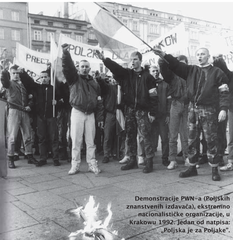
Demonstracije PWN-a (Poljskih znanstvenih izdavača), ekstremno nacionalističke organizacije, u Krakowu 1992. Jedan od natpisa: „Poljska je za Poljake”.