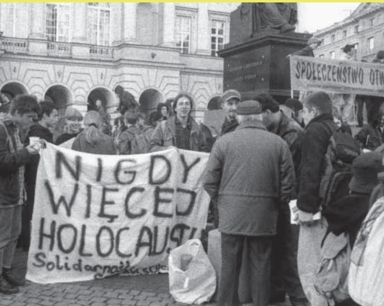
'Holokaust - nikad više'. Antifašističke demonstracije u Varšavi, 1996.