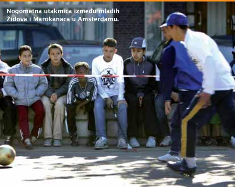
Nogometna utakmica između mladih Židova i Marokanaca u Amsterdamu.