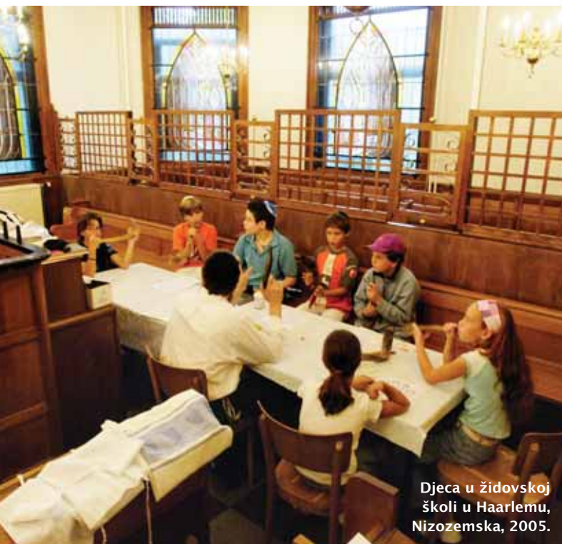
Djeca u židovskoj školi u Haarlemu, Nizozemska, 2005.

2. Ministarstvo prosvjete i športa Republike Hrvatske donijelo je 2003. odluku da se svake godine 27. siječnja obilježava Dana sjećanja na holokaust i sprječavanje zločina protiv čovječnosti. Godine 2005. Ujedinjeni su se narodi složili da će se 27. siječnja, dan kad su sovjetske trupe oslobodile Auschwitz, obilježavati kao Dan sjećanja u svim zemljama.