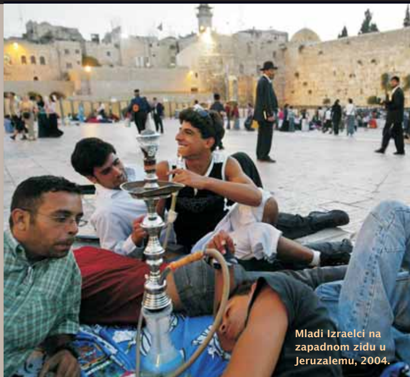
Mladi Izraelci na zapadnom zidu u Jeruzalemu, 2004.

Židovi su započeli emigraciju iz Europe u Palestinu u 19. stoljeću kako bi pobjegli od antisemitizma. Povećavali su postojeće židovske zajednice živeći na zemlji koju su kupovali od arapskih zemljoposjednika. Britanski upravitelji davali su nadu i Židovima i Palestincima da će moći osnovati svoju vlastitu državu. Želja obiju grupa da osnuju svoju vlastitu državu na istome području začetak je sukoba oko teritorija koji traje do današnjeg dana. Godine 1947. Velika Britanija najavljuje povlačenje s teritorija, a u studenome Ujedinjeni narodi usvajaju rezoluciju o podjeli bivšega britanskoga povjereništva. Velik dio arapskih zemalja, međutim, glasuje protiv rezolucije.