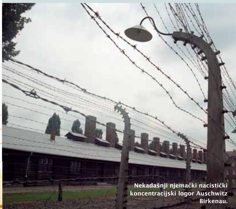
Nekadašnji njemački nacistički koncentracijski logor Auschwitz Birkenau.

B. Napiši kako se u tvojoj školi obilježava Dan sjećanja na holokaust i sprječavanje zločina protiv čovječnosti.