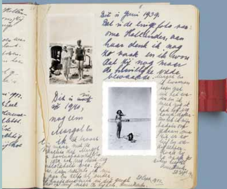
Dnevnik Ane Frank

Manji broj Židova koji su preživjeli rat, a nisu emigrirali, pokušao je izgraditi nov život u Europi. Zbog holokausta jedva da je ostalo nešto od tisuća židovskih četvrti u selima i gradovima diljem kontinenta. Tijekom godina neki su se aspekti židovske kulture polako vratili; posebne pekarnice i restorani, tu i tamo pokoja sinagoga. U isto vrijeme Europljani su se susreli s novim izrazima antisemitizma. Nijekanje holokausta jedan je od njih. Drugi pak ne niječu postojanje holokausta, ali umanjuju njegovu važnost.